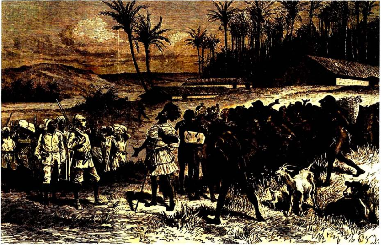
Idealitzada visió d'un contacte cultural al segle XIX: « Com van ser acollits a Ka-Babarré (Manyema) » ( El mundo ilustrado , Barcelona, 1880).