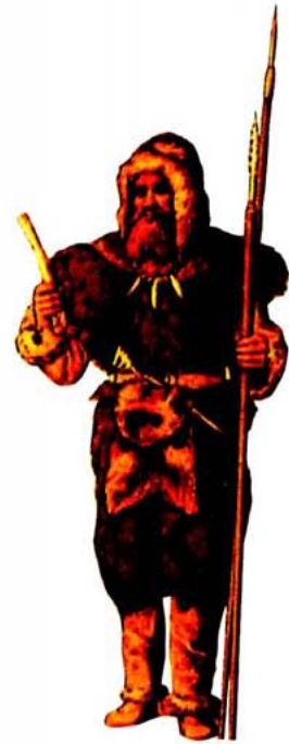
«Home de Cro-Magnon de l'era paleolítica». («Le Costume historique», 1888).

Després de la segona guerra mundial es va produir el context sociohistòric adient per a la revalorització dels caçadors-recol·lectors, històrics i prehistòrics. En primer lloc, Europa disposava d'una llarga tradició arqueològica d'estudis sobre els caçadors prehistòrics i s'hi aplicaven nous mètodes cronomètrics que permetien datar els jaciments per damunt d'1,5 milions d'anys. Aquesta circumstància farà del continent africà un escenari privilegiat per a múltiples programes d'investigació sobre Paleontologia humana, majoritàriament vinculats a fundacions i universitats nord-americanes. En segon lloc, serà decisiva l'actualització de l'evolucionisme, que des dels anys trenta s'estava produint en l'antropologia americana. Com a punt final de la confluència de totes aquestes circumstàncies, el 1966 s'organitza a la Universitat de Chicago la conferència Man the Hunter , que malgrat les nombroses crítiques que va suscitar continua essent una referència obligada. Havia arribat el moment de conèixer l'origen de la nostra espècie i de sistematitzar-ne l'evolució cultural.