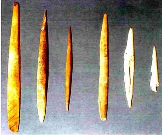
Arpons i atzagales òssies. Magdalinense. Cova del Parpalló.

forma i les dimensions dels seus equips de caça i pesca que s'observen a partir de l'expansió dels humans actuals. Aquesta qualitat de les armes ha fet que la distribució cartogràfica dels projectils de pedra, d'os i de banya —perquè els fabricats de fusta només s'han conservat excepcionalment— hagen estat identificats com a límits territorials d'àmplies cultures arqueològiques, sense que la seua equivalència amb altres tantes entitats socials siga possible fins als moments finals de l'evolució dels caçadors prehistòrics.