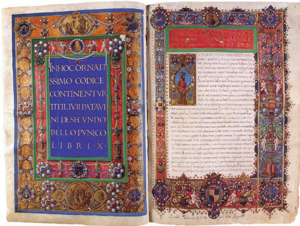
Titus Livi, «De Secundo Bello Punico Libri X», Florència, 1480-1490. [Biblioteca Universitària, Universitat de València].

Titus Livi va fer un extens i grandió relat de la presa de Sagunt per Anníbal.