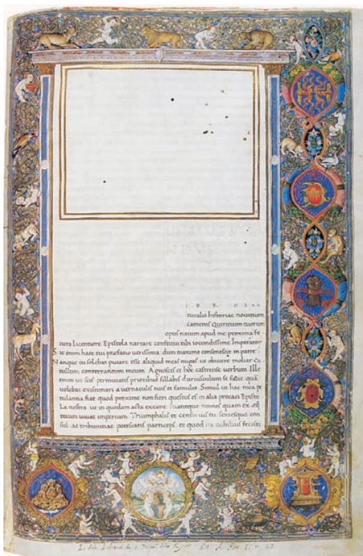
Plini el Vell, « Historia Naturalis », Nàpols, últim terç del segle XV. [Biblioteca Universitària, Universitat de València].

Veritable enciclopèdia de sabers del món romà, en el seu llibre tercer ens facilita la millor descripció de l'organització territorial administrativa del segle I de les províncies hispanes.