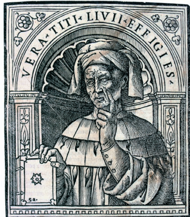
Retrat de Titus Livi. T. Livius, «Historicus duobus libris auctus: cum L. Flori epitome ... Leonardo Aretino de primo bello punico», Venècia, 1520. [Biblioteca Universitària, Universitat de València].

Titus Livi va fer un extens i grandió relat de la presa de Sagunt per Anníbal.