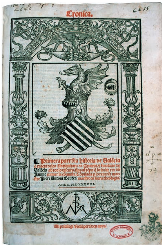
P.A. Beuter, «Primera part de la Història de València», València, 1538. [Biblioteca Històrica. Universitat de València].

Pere Antoni Beuter (1490/95-1555) és l'iniciador d'un nou model historiogràfic, imitat posteriorment en múltiples variants.