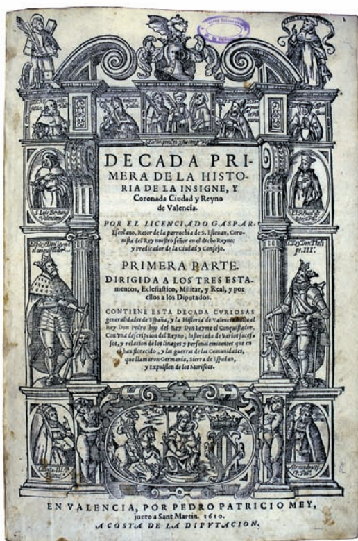
G. Escolano, « Décadas de la historia de la insigne y coronada ciudad y Reino de Valencia », València, 1610.

Gaspar Escolano (1560-1619) constituïx un nou gir en la historiografia valenciana, per la seua nova estructura i extraordinària exhaustivitat.