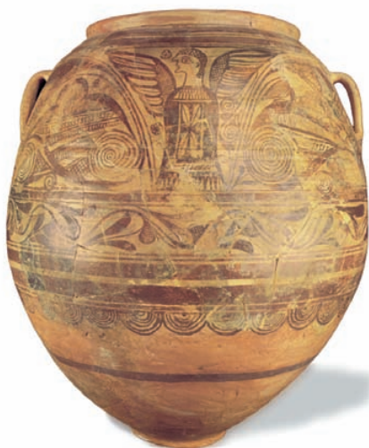
Got de Tanit de l'Alcúdia (Elx, Alacant). [Museu Arqueològic Municipal d'Elx Alejandro Ramos Folqués].

L'estil d'Elx-Archena és el màxim exponent de l'auge de la ceràmica ibèrica a la Baixa Època. Este focus artístic va desenvolupar un complex imaginari ibèric, ple de simbologies i divinitats, on les deesses alades i les aus amb les ales esteses són els personatges més representats.