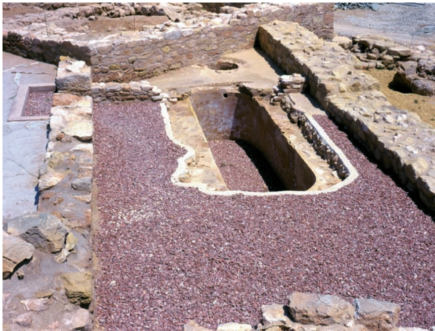
Cisterna púnica del Tossal de Manises, Alacant.

A primeries del segle II aC, amb la nova administració romana, s'inicia un període conegut com romanització, que s'entén com un procés complex d'interacció entre conquistador i conquerit, que es va desplegar a llarg termini i va estar dotat de múltiples manifestacions. Lluny de la pretesa uniformitat que es tendeix a veure sota l'epígraf de Roma, la diversitat cultural dels pobles ibers conquerits va fer que aquest procés fóra diferent d'unes àrees culturals a unes altres.