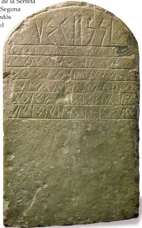
Estela de Sinarques, València. Segle I aC. [Museu de Prehistòria de València].