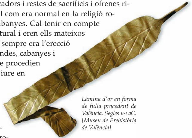
Làmina d'or en forma de fulla procedent de València. Segles II-I aC. [Museu de Prehistòria de València].

Amb el pas del temps, va sorgir una ciutat del més pur aspecte romà, amb una arquitectura totalment aliena al món ibèric. La troballa d'un cementeri d'aquest període és una altra prova conculcent de la italianitat d'aquests primers habitants, com mostren els ritus d'inhumació i les ofrenes de caps de porc.