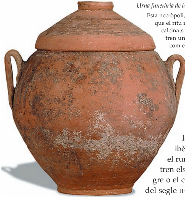
Urna funerària de la Calerilla de Hortunas (Requena, València).