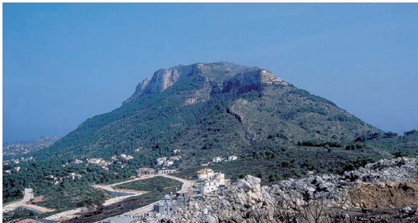
La Peña de l'Àguila, Dénia. [Fot. Josep Castelló].

Exceptuant la ciutat de Saguntum , i en menor mesura Lucentum , que viuen una forta monumentalització al segle II aC, els jaciments ibero-romans valencians no evidencien transformacions urbanístiques com ocorre a la vall de l'Ebre, amb els oppida ibèrics del Cabezo d'Alcalá de Azaila o el Cabezo