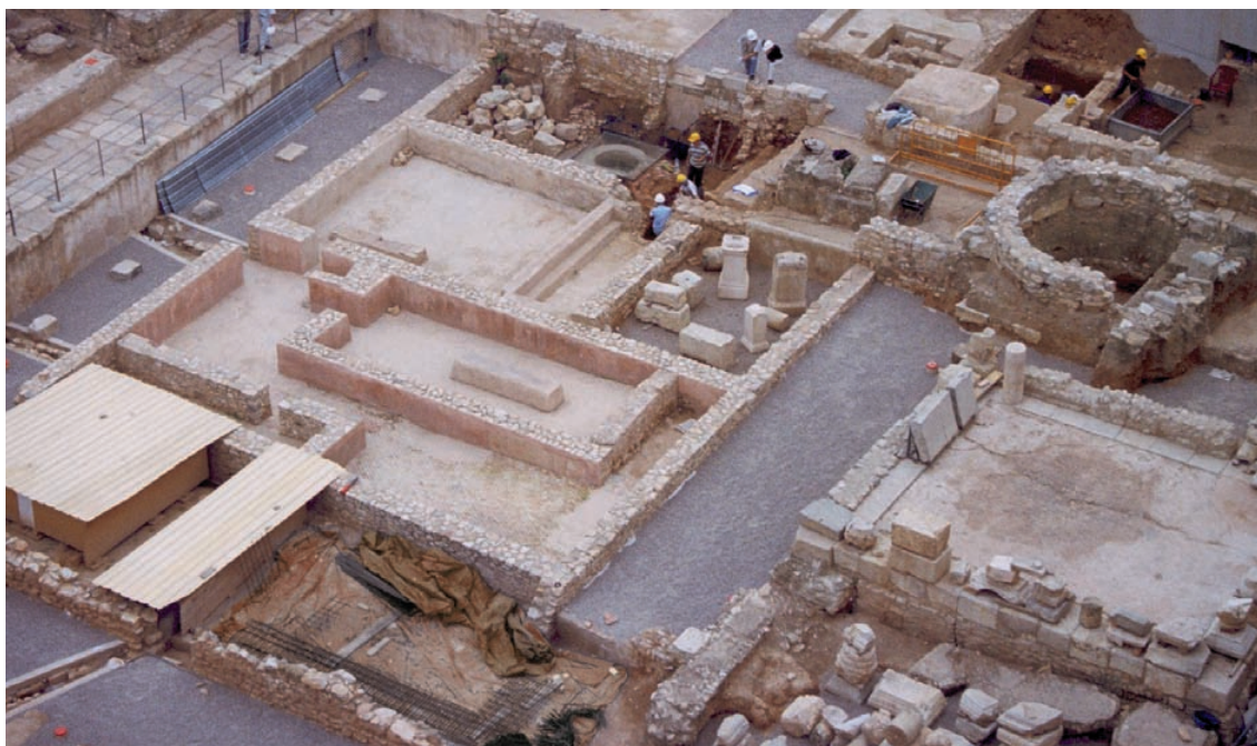
Termes de l'Almoína, València.

Les motivacions estratègiques d'aquest nou centre urbà són evidents, ja que es troba just a mitjan camí entre Tarraco i Carthago Nova (Cartagena), que eren les principals i úniques ciutats romanes de la província Citerior, situades a 500 km, estant-ne València equidistant, a 250 km de cadascuna, prova de la seua intencionada ubicació per a controlar una àmplia província en la qual encara era molt escassa la presència romana directa. El moment d'aquesta nova fundació també coincideix amb una reforma de la xarxa viària d' Hispania . No és clar si la nova fundació es va crear al costat de la via Hercúlia, la predecessora de la Via Augusta, o si aquesta es va traslladar al lloc ocupat per la ciutat.