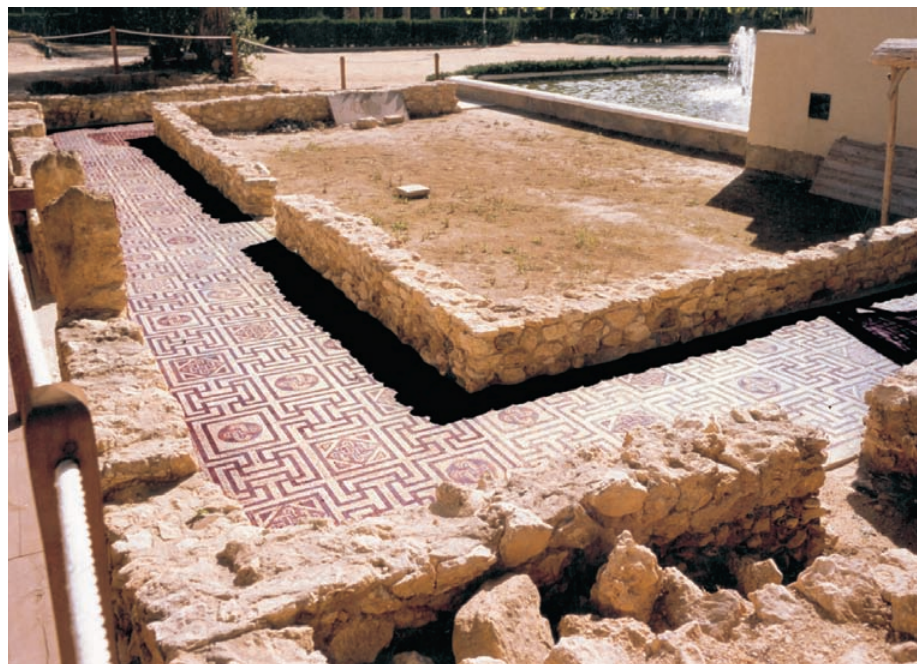
Casa amb mosaic del Palmeral (Portus Ilicitanus). [Fot. M. J. Sánchez].

Este edifici es coneixia des del començament del segle xx, però no ha sigut fins fa poc quan s'ha explicat amb claredat. Amb anterioritat s'havia interpretat erròniament com una sinagoga. El mosaic també s'havia prestat a confuses digressions, fins que s'hi ha reconegut un fragment del naufragi de Jonàs, tema recurrent en la iconografia cristiana del segle IV.