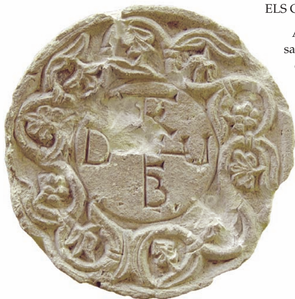
Anagrama de Teudemir. Pla de Nadal (Riba-roja de Túria). [Museu de Prehistòria de València].

A l'hora d'entendre el que era un grup episcopal, no hem de pensar en una sèrie d'esglésies i edificis aïllats envoltats per cementeris desordenats que s'estenien capriciosament, sinó més bé al contrari, l'àrea episcopal seria com un gran barri perfectament delimitat, un poc bigarrat però ordenat, on residien els jerarquies eclesiàstiques més importants de la ciutat i de tota l'ampla rodalia jurisdiccional. El de València ocuparia una superfície mínima de 150 per 100 metres en la mateixa zona de l'Alcàsser de