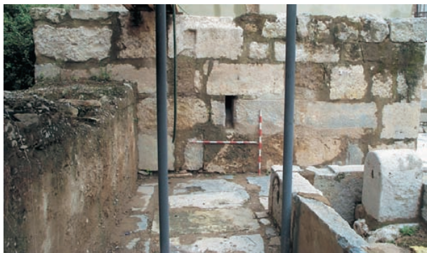
Baptisteri de Valentia. L'Almoína. [Arxiu SIAM].

Un dels edificis més emblemàtics i monumentals dels nuclis episcopals era el seu baptisteri. El de València acaba de ser identificat en les excavacions del solar de l'Almoína. Està construït amb grans carreus romans i presenta la particularitat d'estar situat al costat de l'absis de la catedral i no als peus de la basílica com sol ser habitual.