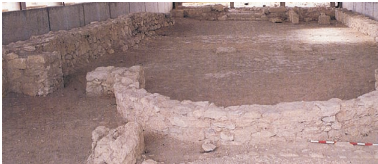
Basílica d'Ilici (l'Alcúdia d'Elx, Alacant).

Només a partir de finals del segle v detectem les primeres grans transformacions urbanes, la reorganització de l'espai, l'espoli sistemàtic d'alguns edificis romans i el primer cementeri dins de la ciutat.