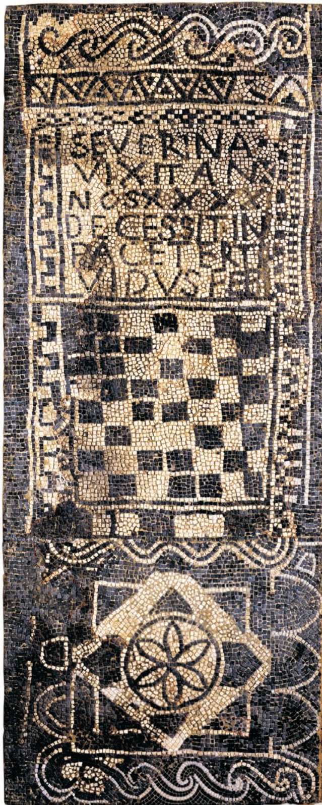
Làpida en mosaic de Severina, procedent de Dénia. Segle v. [Museu de Belles Arts de València].

En un lateral s'obri un orifici tallat en la unió de dos carreus, de forma que els líquids que s'hi aboquen des de l'exterior es vessen per l'interior fins al fons de la tomba, on es trobarien les restes dels soterrats allí. És un exemple monumental dels anomenats «orificis de libació» que tenen com a finalitat que els difunts puguin participar directament de les ofrenes realitzades en la seua memòria.