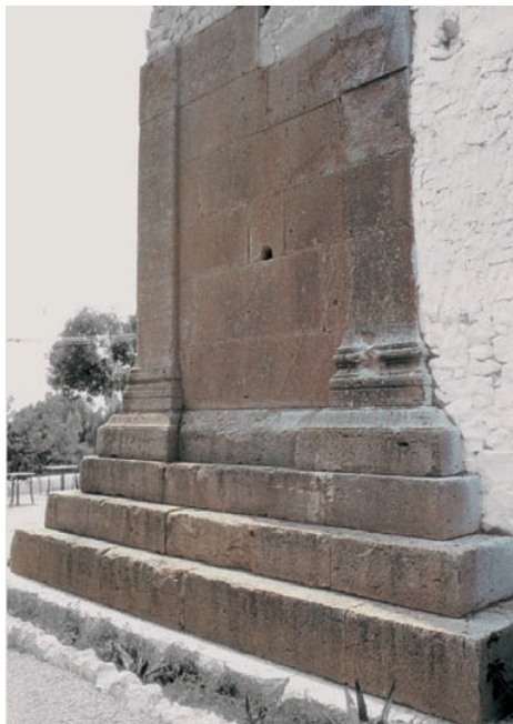
Orifici de libació de la torre funerària de Sant Josep a la Vila Joiosa (Alacant).

En un lateral s'obri un orifici tallat en la unió de dos carreus, de forma que els líquids que s'hi aboquen des de l'exterior es vessen per l'interior fins al fons de la tomba, on es trobarien les restes dels soterrats allí. És un exemple monumental dels anomenats «orificis de libació» que tenen com a finalitat que els difunts puguin participar directament de les ofrenes realitzades en la seua memòria.