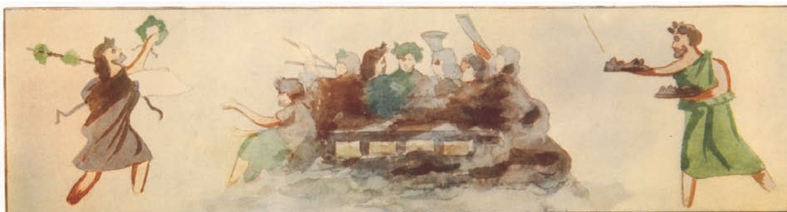
Decoració parietal desapareguda de la tomba del Banquete de Carmona (Sevilla) segons R. Jaldón. Segle I.

Un conjunt de tombes excavat a Valentia per Pierre Guérin proporciona nova llum sobre aspectes del ritual funerari. La necròpolis se situa al llarg del decumanus màxim, fora del recinte urbà, i s'utilitzà des de la fundació de la ciutat fins al segle IV. En la fase republicana del segle II aC, coexisteixen sense ordre aparent inhumacions i cremacions, amb tombes en fossa, tombes de cambra o hipogeu i un ustrinum que es reutilitzà per a inhumacions. La presència des d'un primer moment de tombes de cremació i d'inhumació va fer pensar els autors en la possible coexistència d'una població indígena i una altra de forana, encara que un estudi més profund dels aixovars i dels ritus funeraris va permetre matisar aquesta hipòtesi, en el sentit que els dos corresponien a una població exògena que, possiblement a causa de la seua composició heterogènia, alternava els dos ritus; alguns aspectes concrets, com ara la inhumació en hipogeu al costat de caps de porc i de senglar partides longitudinalment, semblen estar en relació amb cerimònies funeràries en honor de Ceres, pròpies del món itàlic, encara que la presència de tombes de cambra i d'estrígils sembla apuntar més aviat cap a un ambient hel·lènic, propi de la Magna Grècia o d'Etrúria.