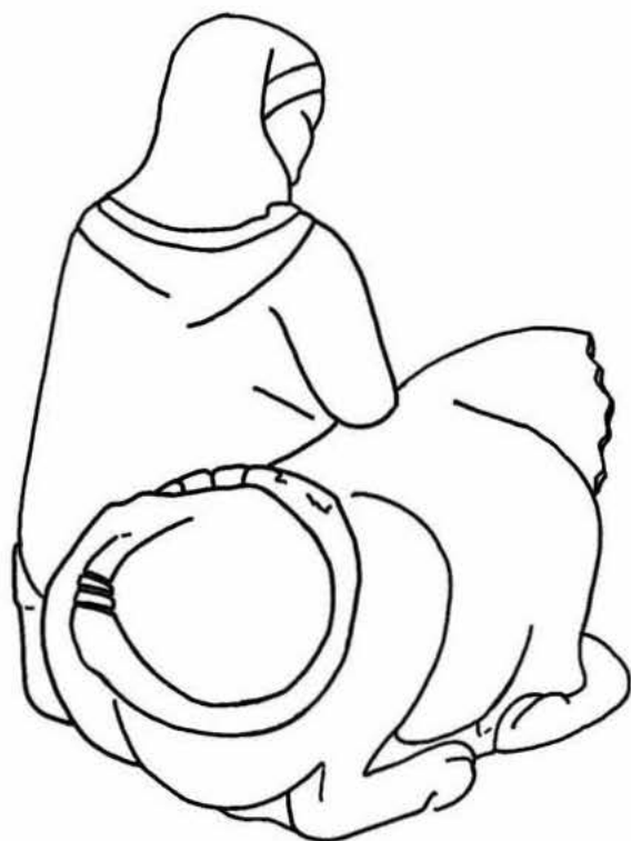
Fig. 1.—Reconstrucción del bóvido ibérico del Museo Arqueológico de Barcelona.