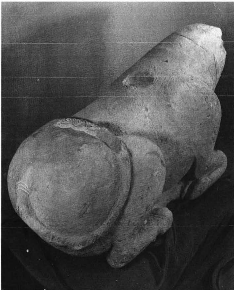
Vista general del bóvido ibérico en piedra del Museo Arqueológico de Barcelona.