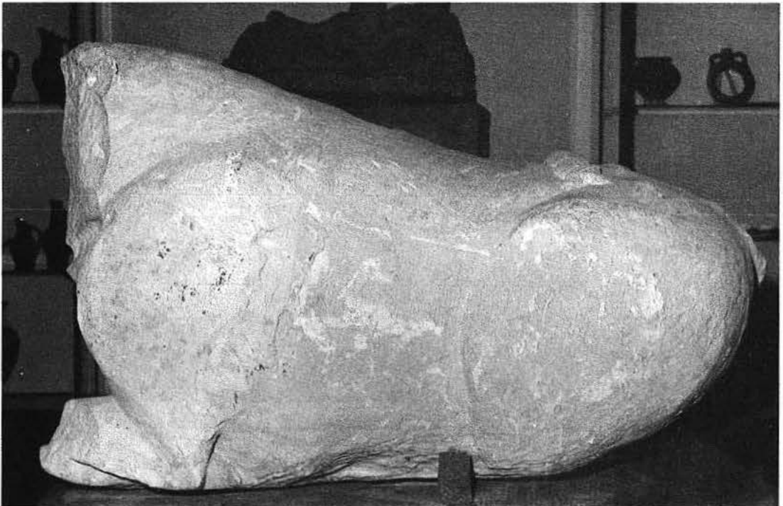
A y B. Vistas laterales derecha e izquierda del bóvido ibérico del Museo Arqueológico de Barcelona.