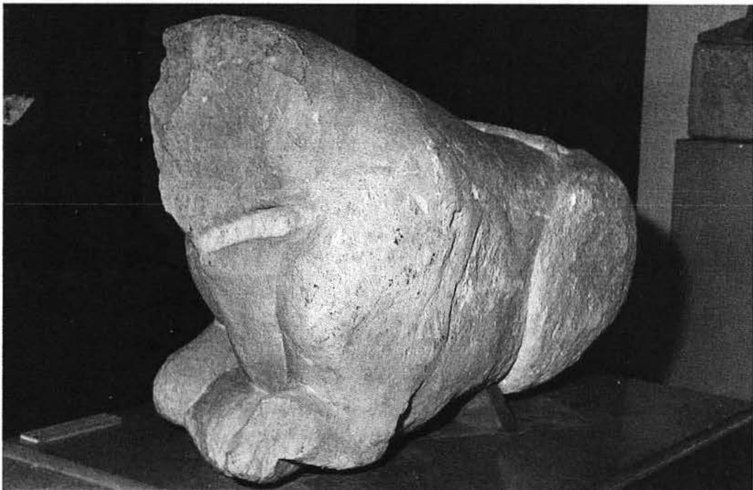
A y B. Vista en escorzo de los costados derecho e izquierdo del bóvido ibérico del Museo Arqueológico de Barcelona.